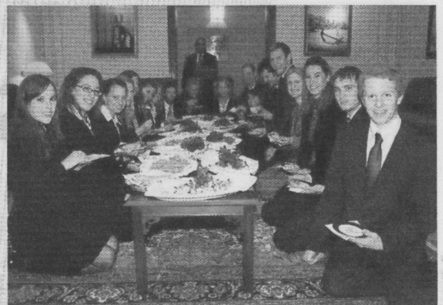
Die Studenten genossen arabische Gastfreundschaft in der Botschaft von Kuwait.

The NMUN affords some 5.000 young and enthusiastic people the chance of obtaining a closer insight into the UN annually. Haus Rissen Hamburg has been helping to send students of all subject to New York since 2007. In March a further three delegations will be prepared, who are then to represent Malaysia, Chile and Ecuador. Visits to the various embassies have already been arranged.