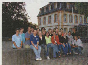
Kämpfer für Benachteiligte - WHU-Studenten

„WHU-Studenten helfen e.V. ist eine im Herbst 2004 gegründete studentische Initiative an der WHU - Otto Beisheim School of Management in Koblenz-Vallendar mit dem Ziel, soziales Engagement innerhalb der Studentenschaft zu fördern und auszuführen.