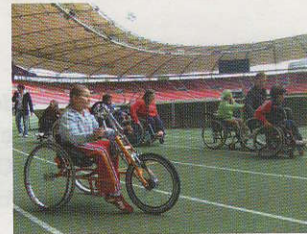
Die MTV Wheelers wurden vom Junior Business Team auf einem Ausflug begleitet, um ihn zu dokumentieren. Dabei ging es auch ins Daimler Stadion in Stuttgart.