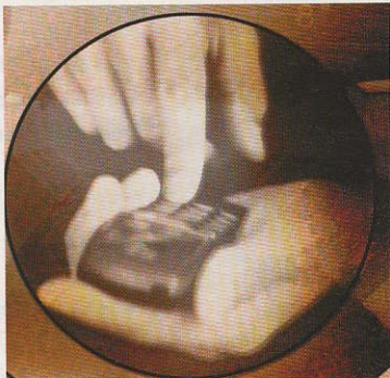
„Wir hören zu“ - so lautet der Slogan von der Nightline in Heidelberg.

Jeder kennt die Situation – man wälzt sich abends im Bett und kann partout nicht einschlafen, weil die Probleme drücken. Was tun? Bei der Nightline anrufen. Fünf Mal in der Woche sind die studentischen Ansprechpartner genau für solche Situationen da. Die persönliche Motivation sich ein paar Nächte um die Ohren zu schlagen, beschreibt ein Mitglied, das nicht namentlich genannt werden möchte, so: „Es fühlt sich einfach super an, etwas Gutes zu tun. Am Ende eines Gesprächs das Gefühl zu haben, dem anderen geholfen zu haben, das befriedigt einfach. Im Studium frage ich mich manchmal, warum ich diese Dinge überhaupt lernen muss. Hier nie.“ Die Probleme der Anrufer lassen sich in vier Bereiche einteilen: Beziehung, Familie, Freundschaft und Studium. „Bei machen Anrufern ist es nicht einfach, nach einem Gespräch abzuschalten und sich zu Hause ins Bett zu legen. Aber man lernt damit umzugehen und wir haben ja auch professionelle Unterstützung.“ In Gruppengesprächen, Schulungen und mit psychologischer Supervision bilden sich die Mitglieder weiter und rüsten sich für alle möglichen Probleme. In den Gesprächen soll Hilfe zur Selbsthilfe gegeben und keine fertigen Lösungsansätze präsentiert werden. Die Nightline gibt es auch in Freiburg und Zürich.