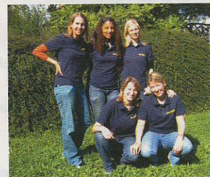
Fünf engagierte Mädels von der ebs.

„Das Kultur & Charity Ressort agiert als Plattform für soziales und kulturelles Engagement der Studenten der ESB Reutlingen. "ESB für Dich" ist hierbei unser Motto. Dieses Jahr wird das Ressort von fünf Studentinnen des vierten Studienjahres geleitet. Wir, das Kultur & Charity Ressort, vertreten die Überzeugung, dass neben Beruf und Studium der Blick für die Mitmenschen und ihre individuellen Bedürfnisse nicht verloren gehen darf. Deshalb möchten wir uns unserer sozialen Verantwortung stellen und der Region, in der wir jetzt für zwei Jahre zu Gast sind, auch etwas zurückgeben. Aus diesem Grund haben wir uns die folgenden Ziele gesetzt: - Sensibilisierung der Studenten für soziale Belange - Leistung von Beiträgen finanzieller und personeller Art zur Unterstützung der jeweiligen bedürftigen Zielgruppen - Stärkung der direkten Verbindung zwischen Hochschule und Region.