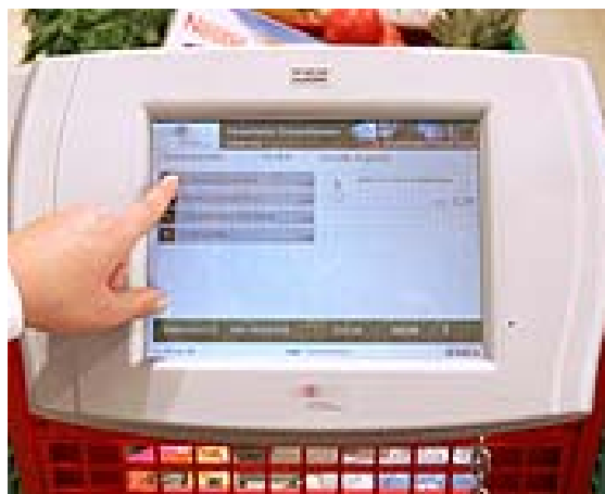
Abb. 6: Personal Shopping Assistant

Für den Händler selbst stellen sie eine exzellente Möglichkeit dar, gezielte Datenanalyse zu betreiben. Über die auf der Kundenkarte und dem benutzten Computer gespeicherten Informationen kann er die Sensitivität des Kunden gegenüber den Aktionen und deren Effektivität bestimmen. Dies erlaubt ihm, den Konsumenten und sein Kaufverhalten besser zu verstehen und Handlungsalternativen abzuleiten. Der PSA ermöglicht also eine zielgenauere Kommunikation mit dem Kunden, die seine Einkaufsstättenloyalität sowie die Bonsumme für den Händler zum Positiven beeinflussen kann.