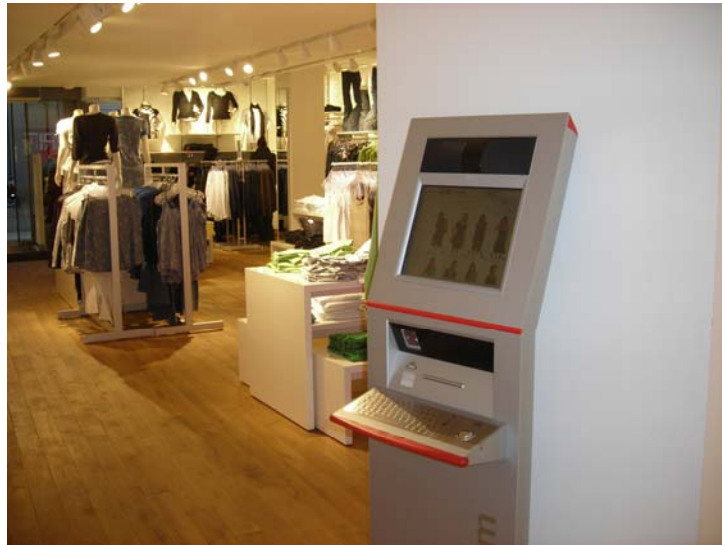
Abb. 3: Kiosk