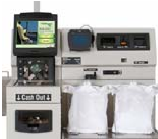
Abb. 4: Self-Checkout-Terminal