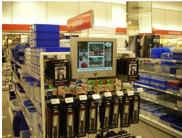
Abb. 5: Ladenfernsehen