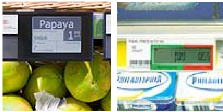
Abb. 2: Elektronische Preisschilder